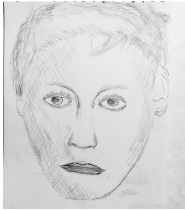
Calle 11 år